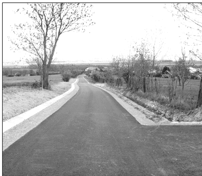
Nová asfaltová cesta přes Svrchnici

Naše obec tak převzala dílo v účetní hodnotě 7.010.112 Kč vč. DPH. K úplnému a bezpečnému provozu na této komunikaci chybí doplnit dopravní značení a umístit dopravní zrcadlo do nepřehledné křižovatky v Hrošce ve směru na Trnov.