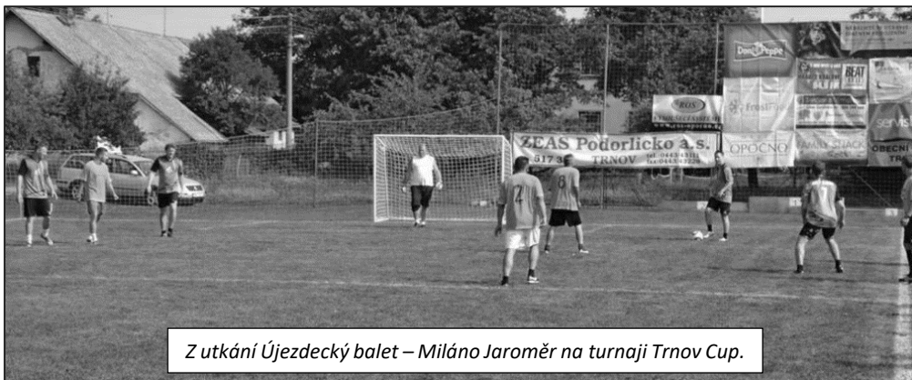
Z utkání Újezdecký balet – Miláno Jaroměr na turnaji Trnov Cup.

prohráli. V osmifinále jsme narazili na vítěze z roku 2015, tým Ruce v bok. Fotbalovějšího soupeře jsme rozhodně potrápili, ovšem po prohře 1:2 jsme se museli s turnajem rozloučit.