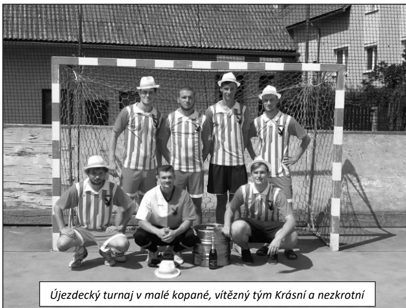
Újezdecký turnaj v malé kopané, vítězný tým Krásní a nezkrotní

Velmi vyrovnaný byl souboj o další příčky. O pořadí na druhém až čtvrtém místě, kde se se shodným počtem šesti bodů umístily tři týmy, muselo nakonec rozhodnout až skóre. Díky gólové produktivitě,