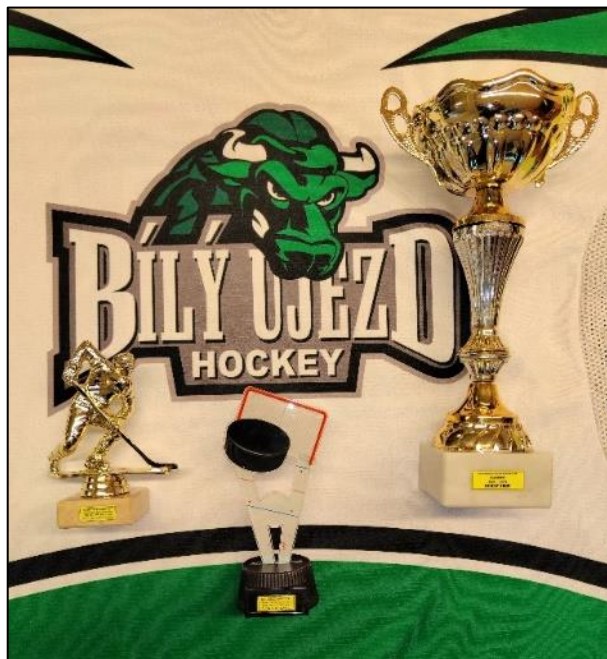
Pohár za 2. místo a individuální ocenění Lukáše Vencla