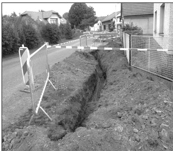
Kabelové výkopy v Mastech

Nočního světla se v Mastech dočkali po dvouměsíční pauze v pondělí 7. 12. 2015 v 18:45 hodin, kdy bylo nové veřejné osvětlení zapnuto ke zkušebnímu provozu. Cena za druhou etapu dle poptávkového řízení byla stanovena na 375 690 Kč.