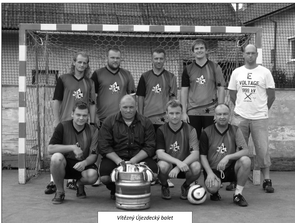
Vítězný Újezdecký balet