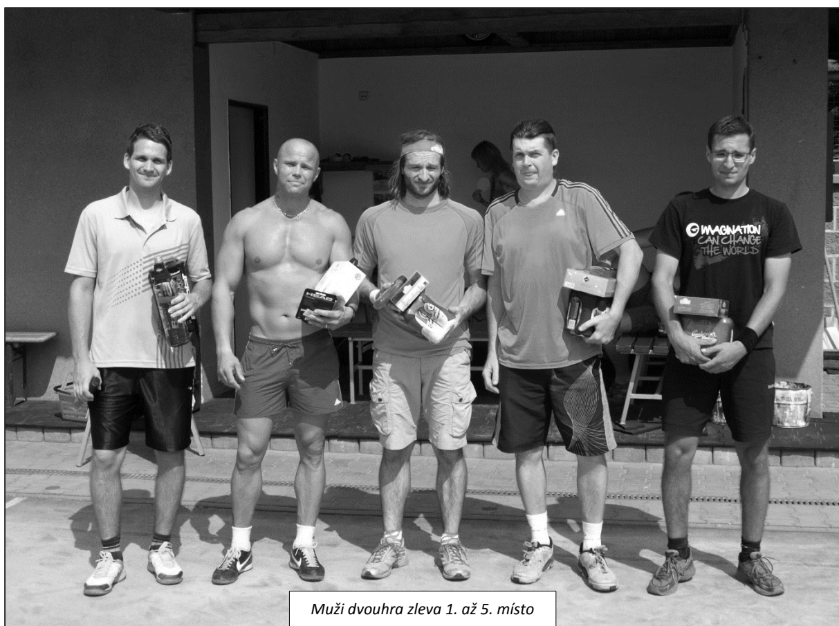
Muži dvouhra zleva 1. až 5. místo