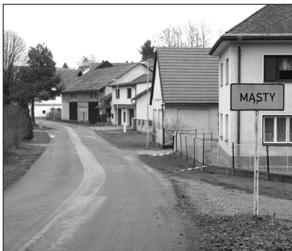
Nové stožáry osvětlení v Mastech

Sníženou intenzitou světla dochází i ke snížení příkonu svítidla a tím k úspoře nákladů za spotřebovanou elektrickou energii. Současně s veřejným osvětlením bylo zrekonstruováno i venkovní osvětlení mastecké kapličky, kde neekonomická halogenová svítidla byla nahrazena diodovým led páskem.