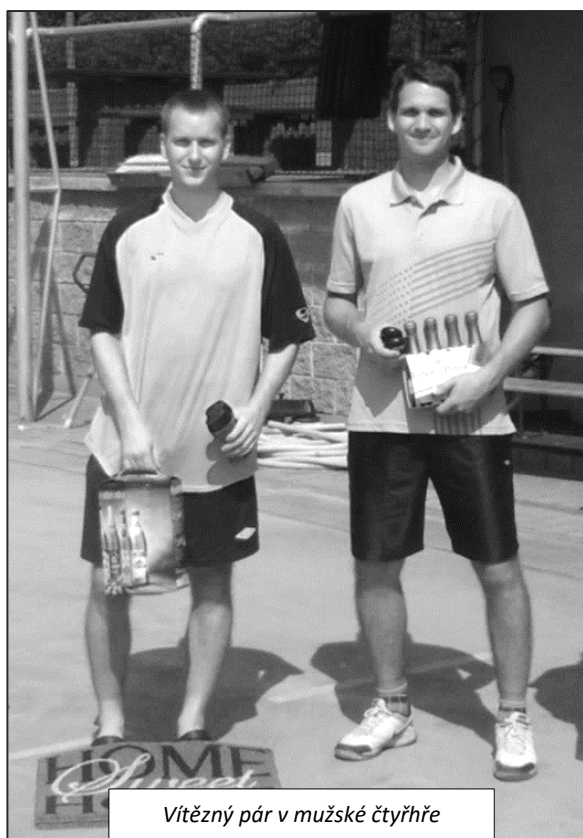
Vítězný pár v mužské čtyřhře